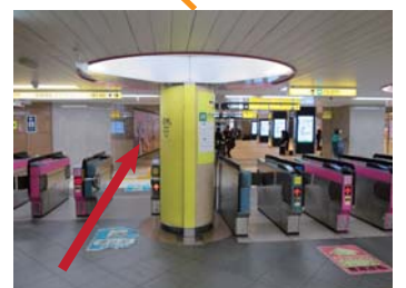
丸ノ内線改札口 手前