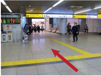
下りエスカレーター乗り口

連絡通路を通して JR 地下中央口改札に突き当たったら、左折して30mほどでみどりの窓口があります。