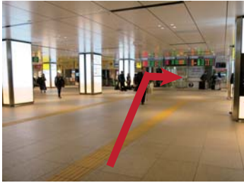
エスカレーター降りた場所