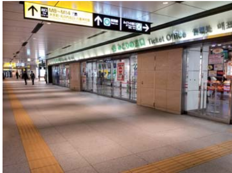
集合 解散 場所